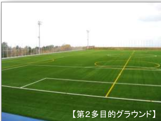
【第2多目的グラウンド】