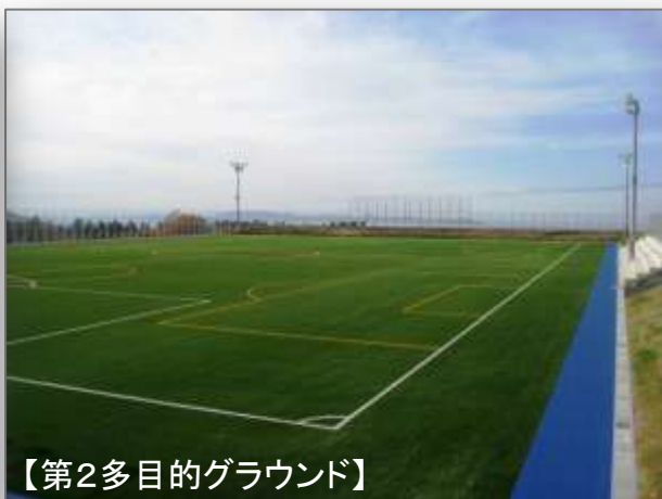
【第2多目的グラウンド】