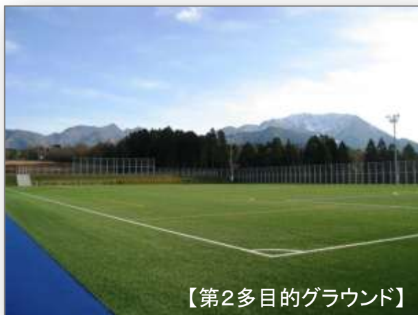
【第2多目的グラウンド】