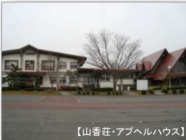
【山香荘・アペルハウス】