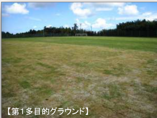
【第1多目的グラウンド】